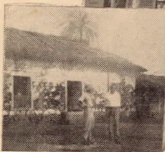
LA ESCUELA "ANDRES BRICEÑO" DE QUEBRADA HONDA

cristalinas surgen tras los cornizuelos; nuestros cuerpos se yerguen sobre la silla. Un oscuro recodo nos descubre repentinamente ante los sonrientes ojos femeniles; las bocas se callan, las miradas se entornan; la nuestra se dilata. Lavanderas, qué felices! Unas viejas, otras de sensual carne