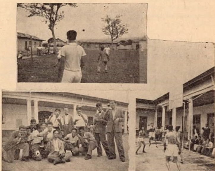
Diversos aspectos de la fiesta del Maíz. El evento de foot-ball, el encuentro de basket - ball y alegre fanfarria comiendo masa-morra.